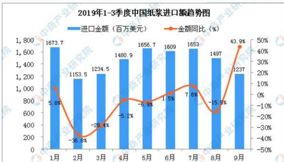
2019年1-9月中国纸浆进口数量及金额增长率情况

从金额方面来看，2019年9月中国纸浆进口金额为1237百万美元，同比增长43.9%。